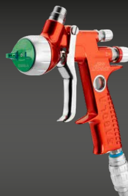
4600 Xtreme HVLP