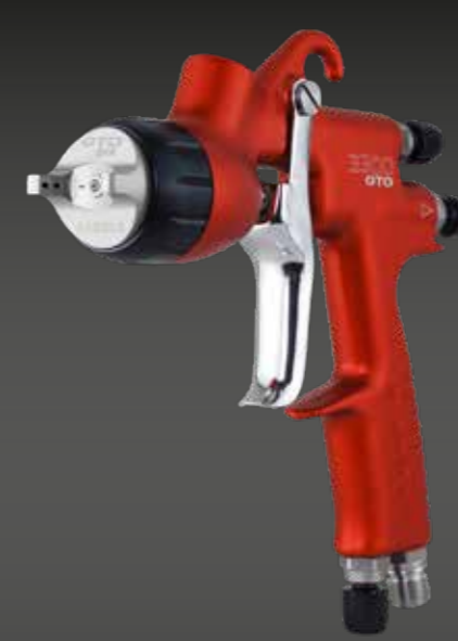
3300 GTO PRIMER