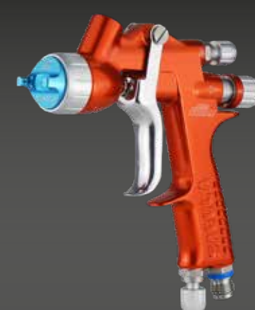
mini Xtreme SPOT REPAIR