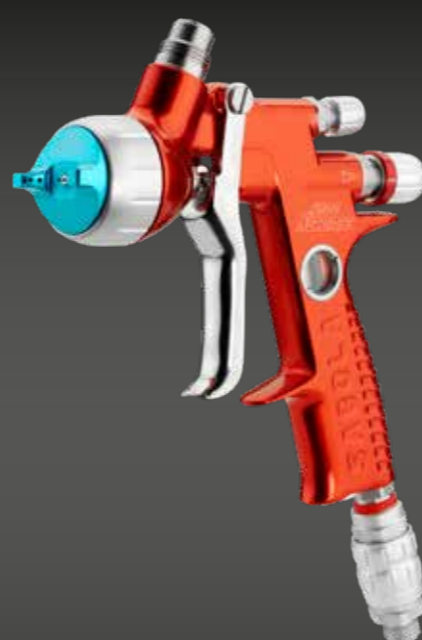
4600 Xtreme AGUA