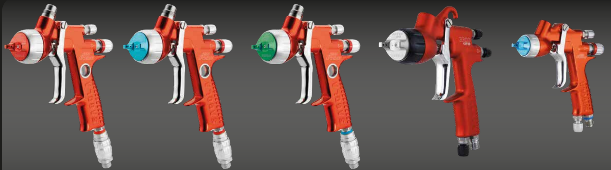
4600 XUREME HS