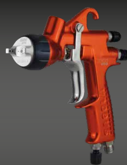
3300 GTO PRIMER