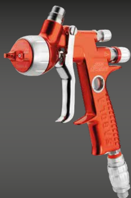
4600 XUREME HS