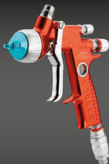
4600 XUREME AGUA