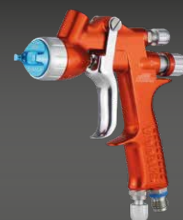
mini XUREME SPOT REPAIR